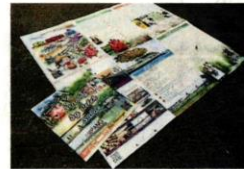
图文并茂的“雪邦·双溪比力·沙叻旅游地图”是游玩雪邦县的好帮手。

许来贤提及，自从发生土崩，乌鲁冷岳了望台已经废置 10 年，州政府收到私人界的建议书，希望重新发展这个景点。